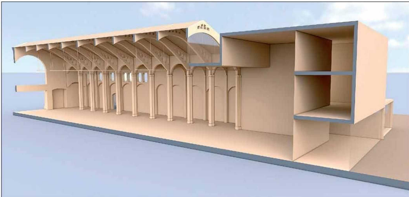
L'edifici també acollirà una gran sala polivalent que es destinarà a usos culturals, com exposicions, obres de teatre, festes populars o conferències.